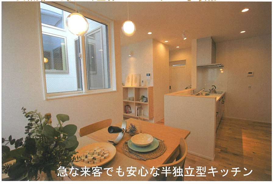
急な来客でも安心な半独立型キッチン